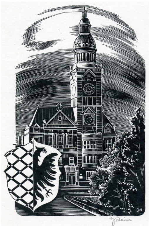
Grafické listy jsou ze soukromé sbírky JV.

Ukázce jeho tvorby je věnováno i toto číslo Echa s poukazem na linoryt na titulní straně, patřící zobrazení náměstí Moravské Třebové.